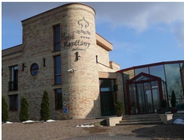
HOTEL KAPITÁNY****Wellness és Konferencia 8330 Sümeg, Tóth Tivadar u. 19.