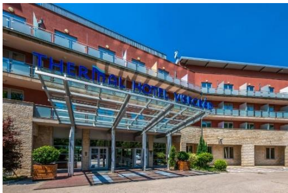
Thermal Hotel Visegrád**** 2025 Visegrád, Lepence völgy 2.